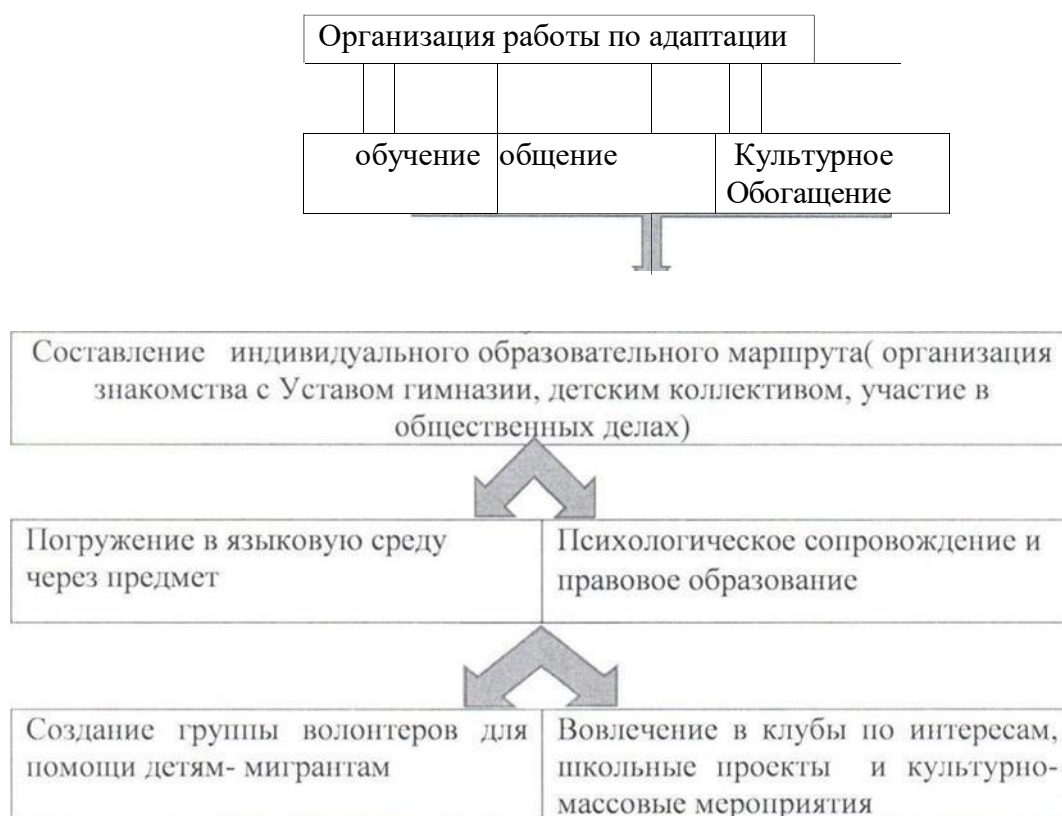
Рис. 3. Уровни 2 этапа

Итак, если ребенок-мигрант намерен обучаться в общеобразовательной школе в Российской Федерации, прежде всего он нуждается в помощи по изучению русского языка. Педагогическая острота проблемы может быть смягчена следующим образом: облегчить изучение нового языка можно с помощью дополнительного или компенсирующего обучения. Важно сохранить для обучающихся-мигрантов возможность говорить на родном языке, интеллектуальные и эмоциональные контакты со своей культурой. В этом случае школьная программа должна включать в себя деятельность, связанную с изучением национальных культур всех участников образовательного процесса. В идеале необходимо сформировать подлинное двуязычие и поликультурность, с помощью которых достигается освоение языков и гармония культур. Даже самое простое решение - посещение дополнительных занятий по русскому языку - может дать хорошие результаты. Далее в соответствии с моделью организация условий для успешной адаптации детей-мигрантов осуществляется одновременно на трех уровнях.