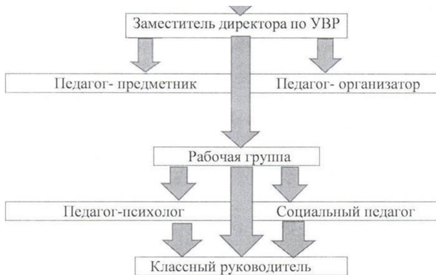
Рис. 1. Схема управления адаптацией

Рабочая группа под руководством заместителя директора и контролем со стороны руководителя образовательного учреждения разрабатывает и осуществляет подбор диагностических методик, тестовых заданий для определения уровня знаний, психологических особенностей, эмоционального состояния детей; определяет содержание периода адаптации, план мероприятий, условия их реализации; решает оперативные вопросы адаптации.