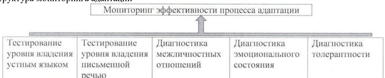
Рис. 5. Структура мониторинга адаптации

Коррекция дальнейшей работы организуется на основании проведенных итоговых тестов и наблюдений, по результатам адаптации разрабатываются предложения по дальнейшей работе с ребенком.